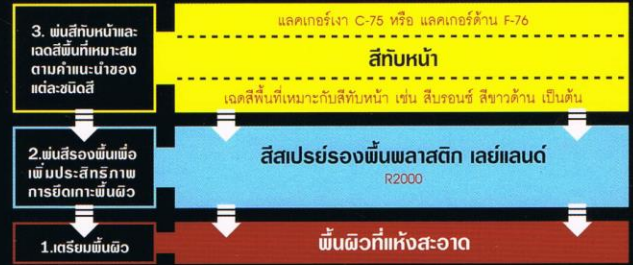
ระบบงานพ่น พื้นผิวพลาสติกกันชน หรือพลาสติกอื่นๆ ยึดเกาะพื้นผิวได้ดีเยี่ยม