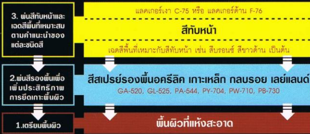
ระบบงานพ่นรถยนต์ จักรยานยนต์ จักรยาน โลหะผิวมัน โลหะผิวเหล็ก ยึดเกาะพื้นผิว นูบรอย และกันสนิมได้ดีเยี่ยม