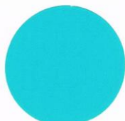
F-7 Fluorescent Signal Green