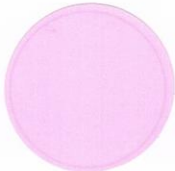
F-2 Fluorescent Aurora Pink