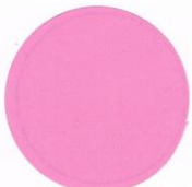
F-1 Fluorescent Magenta