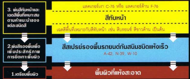
ระบบงานพ่นรถยนต์ เฟอร์นิเจอร์ ไม้หรือเหล็กทั่วไป ยึดเกาะพื้นผิว และกันสนิมได้ดี