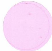
F-4 Fluorescent Pink