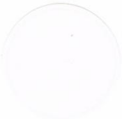
F-10 Fluorescent White (UV Blue)