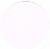
F-8 Fluorescent Saturn Yellow