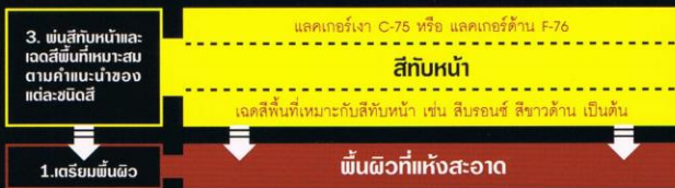
ระบบงานพ่นทั่วไป ยึดเกาะพื้นผิวได้ดี