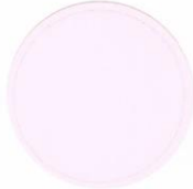
F-6 Fluorescent Orange Yellow