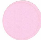
F-5 Fluorescent Orange